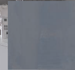
Cape town + Los Angeles