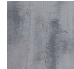
Barcelone + Taipei