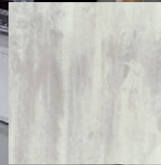
Paris + Moscou