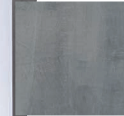
Berlin + Los Angeles