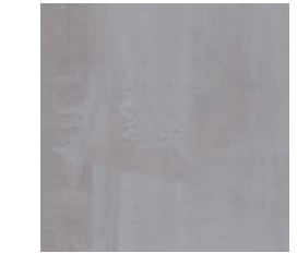
Milan + Taipei

L'exactitude de la reproduction des coloris ne peut être garantie malgré les soins apportés à l'impression.